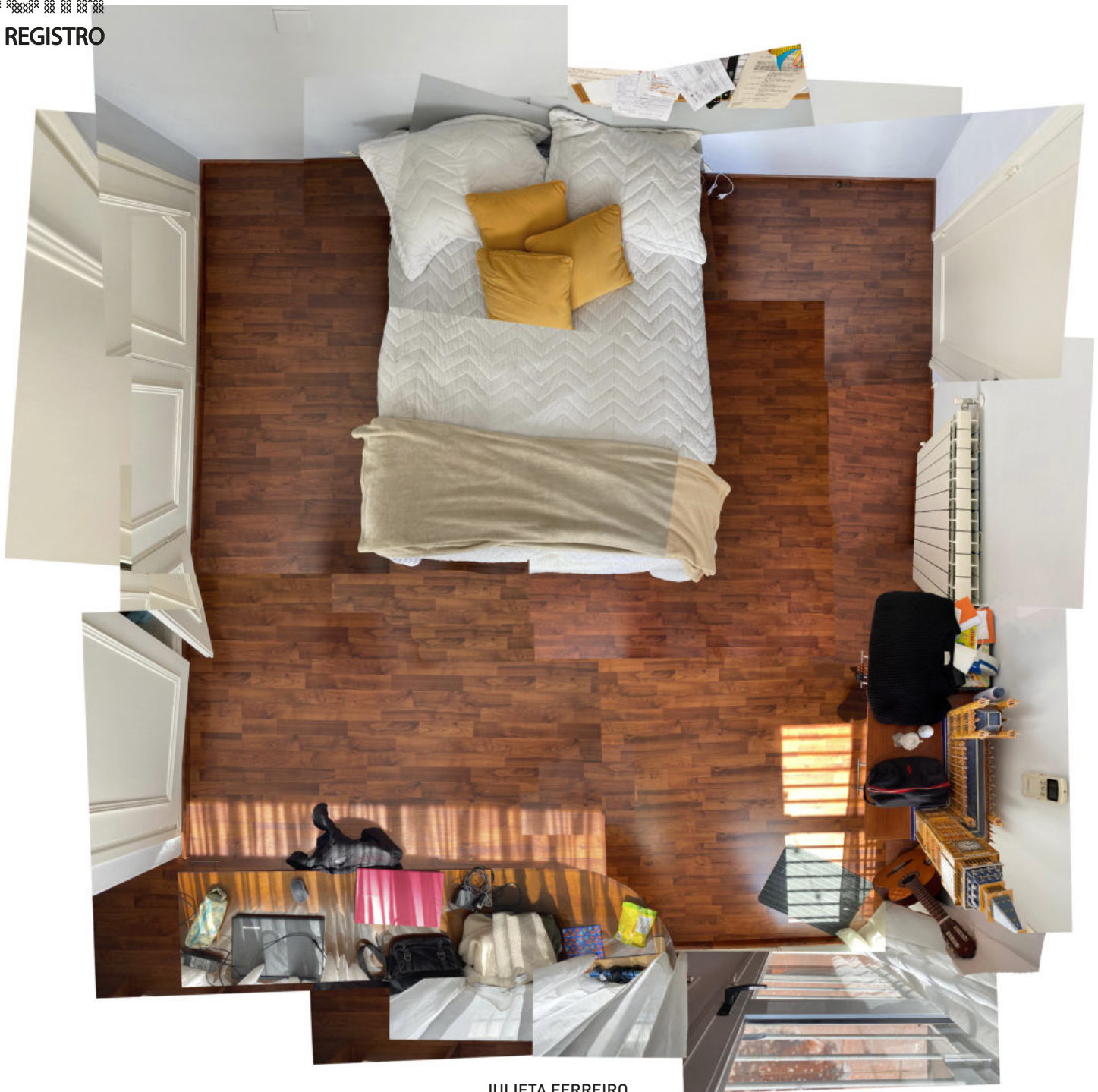
JULIETA FERREIRO limites físicos y sistemas de objetos